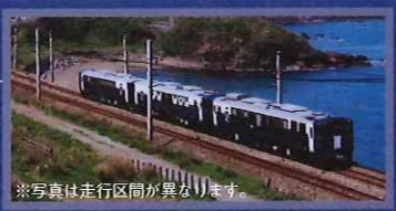
※写真は走行区間が異なります。

新潟～越後湯沢駅間を貸し切り運行。車内では、厳選した新潟県内の銘酒の利き酒や、地元の食材にこだわったおつまみ等をご用意するほか、ジャズの生演奏やお酒にまつわるイベントを実施。